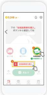
「地域振興券を購入」をタップします。