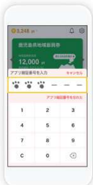
アプリ暗証番号を入力します。