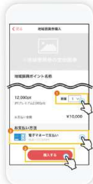
購入する口数およびお支払い方法を確認し、「購入する」をタップします。