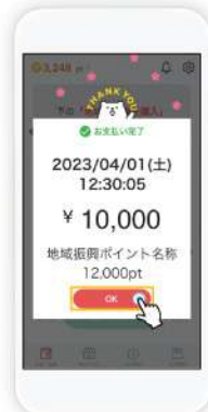
「OK」をタップします。 購入完了!