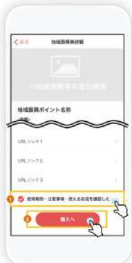
使用期間・注意事項・使えるお店を確認しチェックをつけ、「購入へ」をタップします。