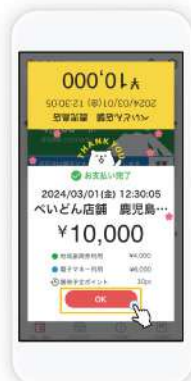
お支払いが完了となります。「OK」をタップします。

「天文館プレミアムポイント」は Payどん アプリの 地域振興券 (緑色のアイコン) から ご購入ください