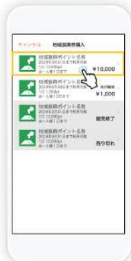
天文館プレミアムポイントをタップします。