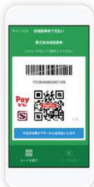
「コードを提示」または「カメラ読み取り」でお店の方に確認します。