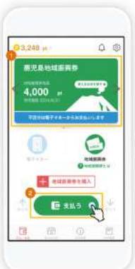
天文館プレミアムポイントを表示してから「支払う」をタップします。